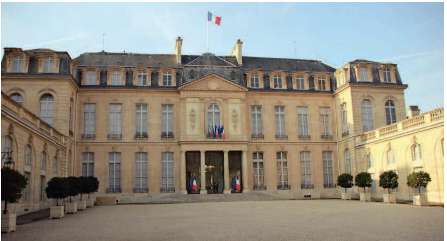
© NICOLAS CUOCO ET SARAH VIOLANTI/MN